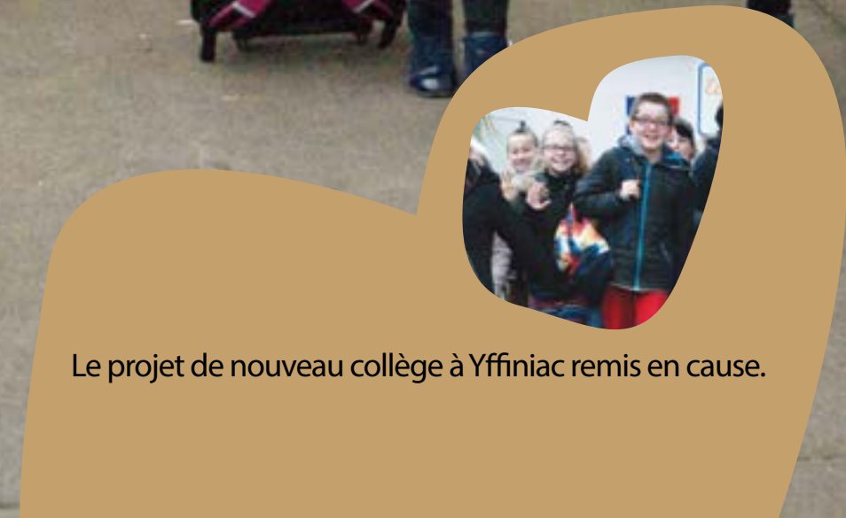
Le projet de nouveau collège à Yffiniac remis en cause.