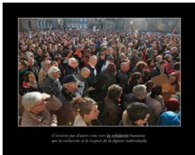
évoquant la solidarité

L'exposition est réalisée par des photographes amateurs et professionnels regroupés au sein de l'association Comptoir des arts de Lamballe. Les thèmes abordés sont nombreux et ont été soigneusement choisis au préalable par le groupe. A travers ces clichés, les photographes traduisent ainsi différents sentiments tels que la colère, l'infidélité, l'indifférence, la jalousie la solidarité, l'espoir, la solitude...