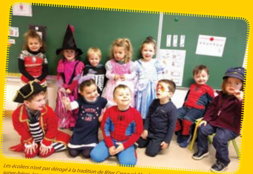
Les écoliers n'ont pas dérogé à la tradition de fêter Carnaval. Mardi 13 février, les princesses ont côtoyé les super-héros, les sorcières ont rencontré les pirates... Les déguisements étaient de sortie pour la plus grande joie des élèves.

* Inventé par l'éditeur Vincent Saffat, le concept Lire c'est parti consiste à vendre des livres tout petit prix afin de favoriser l'accès à la lecture pour tous.