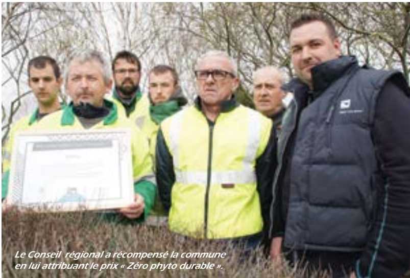
Le Conseil régional a récompensé la commune en lui attribuant le prix « Zéro phyto durable ».

Yffiniac vient d'être récompensée par le prix « zéro phyto durable » décerné par le Conseil régional en janvier dernier. Ce prix récompense les communes engagées dans la pratique « zéro phyto » depuis 5 années. En effet, voilà déjà plusieurs années que la commune n'utilise plus aucun désherbant. Les massifs sont désherbés mécaniquement ou manuellement et de nouvelles pratiques comme le paillage végétal est utilisé. Par ailleurs, la commune va mettre en œuvre cette année un nouveau mode de gestion différenciée de ses espaces verts, plus respectueux de l'environnement. Cette approche consiste à adapter le mode d'entretien aux caractéristiques et fonctions de chaque espace vert. Par exemple, des espaces engazonnés rue Malraux et au plan d'eau des Villes Tanets ne seront plus tondus régulièrement mais fauchés deux fois par an ou entretenus en écopâturage (cf Le Sillon de février 2018).