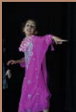
Pour marquer la fin de chaque période, les enfants ont pour habitude de présenter un échantillon du fruit de leur travail. Ce jeudi 22 février, un medley de danses d'hier à aujourd'hui était à l'honneur.